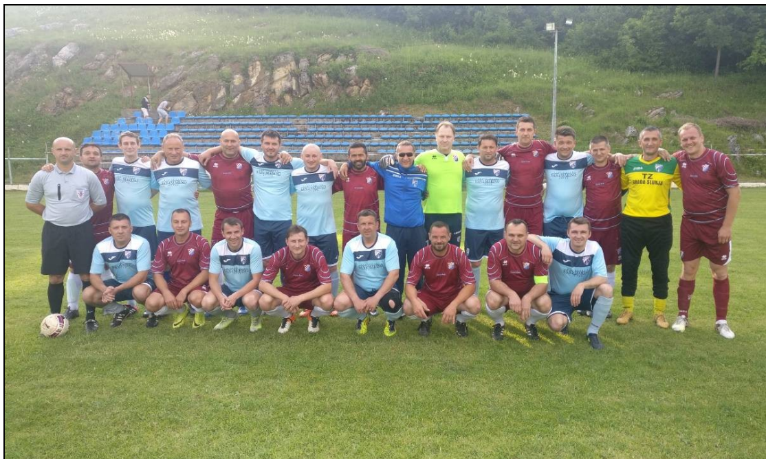
Zajednička slika veterana Slunja i Zrinskog Ozalj