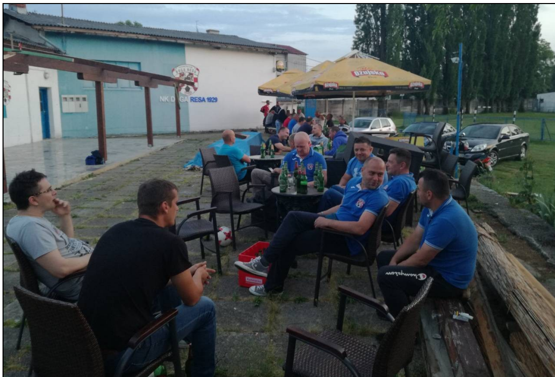
Nakon utakmice VNK Duga Resa – Vojnić 95